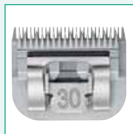
GT317 #30 1/50" | 0,5 mm