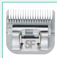
GT360 #5F 1/4" | 6,3 mm