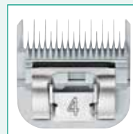
GT366 #4 3/8" | 9,5 mm