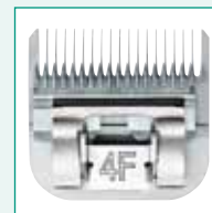
GT364 #4F 3/8" | 9,5 mm