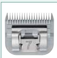
GT343 #7 1/8" | 3,2 mm