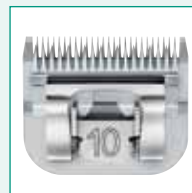
GT330 #10 1/16" | 1,5 mm