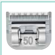
GT305 #50 1/125" | 0,2 mm