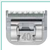
GT310 #40 1/100" | 0,25 mm