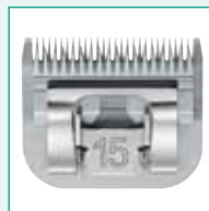
GT326 #15 3/64" | 1,2 mm