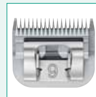
GT333 #9 5/64" | 2,0 mm